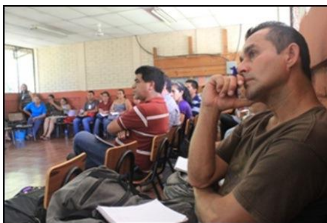
Docentes del municipio de Chalatenango reciben capacitación sobre la Gestión Integral para la Reducción del Riesgo con énfasis en el cambio climático.

Redacción: Kennia Valencia –UNES–, San Salvador, El Salvador.