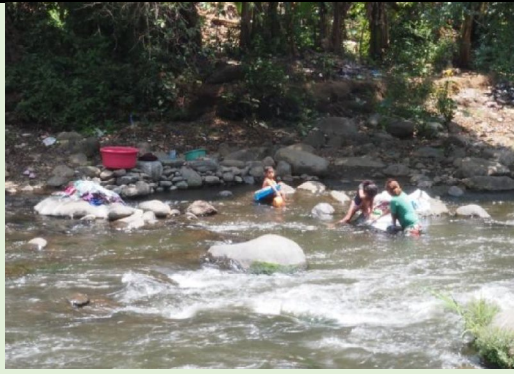
Imagen 5: Mujeres lavando en el río Sensunapán y niño bañando en marzo de 2021