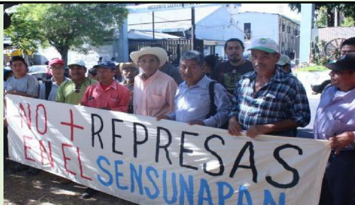
Imagen 1: comunidades indígenas de Nahuizalco en plantón frente al MARN en enero de 2020, exigen que no se otorguen permisos al proyecto hidroeléctrico ya que ya fue sometido a consulta en 2010 y se le negó el permiso

https://www.youtube.com/watch?v=p5wQenwHEFI