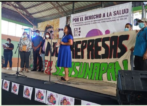
Imagen 6: CIDBN recoge premio Margarita Posadas por sus 17 años de lucha por la protección del río Sensunapán en julio de 2021