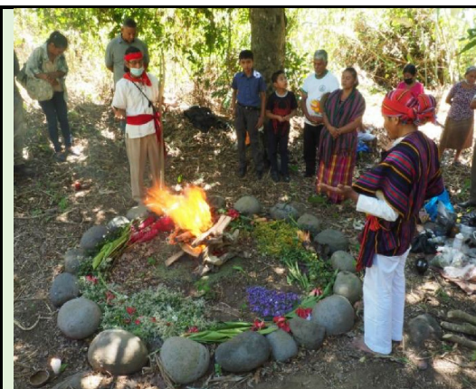
Imagen 2: Celebración del equinoccio en marzo de 2021 en el sitio ceremonial de la poza de El Cital (lugar de las estrellas) ubicada sobre el curso del río Sensunapán