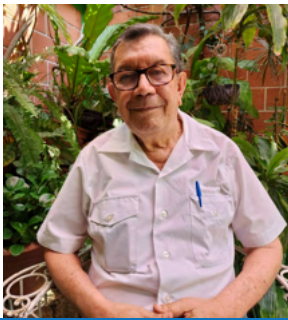
Por Ing. Rosendo Mauricio Sermeño.

El año 2022 ha sido un período en que la población, no solo de El Salvador sino del mundo, va tomando confianza de vencer la pandemia. Mucha gente ya se siente con valor de andar sin mascarilla y las muertes por esta enfermedad han disminuido mucho; sin embargo, aún es bueno guardar precaución. Todo esto ha permitido intensificar nuestro trabajo comunitario.